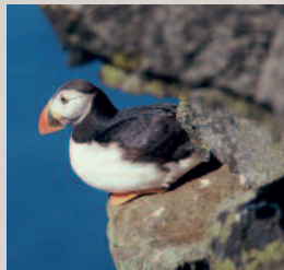
Papageientaucher auf Island