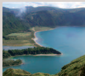
Kratersee Lagoa do Fogo, São Miguel, Azoren