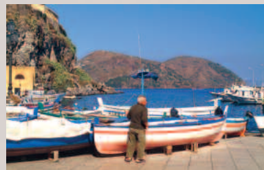
Marina corta, alter Fischerhafen auf Lipari