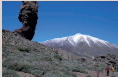
Pico de Teide auf Teneriffa