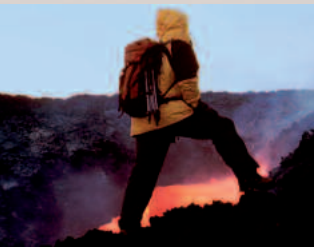
Lavastrom am Ätna