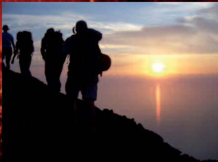
Aufstieg zum Stromboli

Unsere Reisen finden daher im steten Respekt vor der Natur und im Einklang mit der Kultur und Lebensweise des Gastgeberlandes statt.