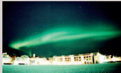
Polarlicht (Aurora borealis) über Reykjavik